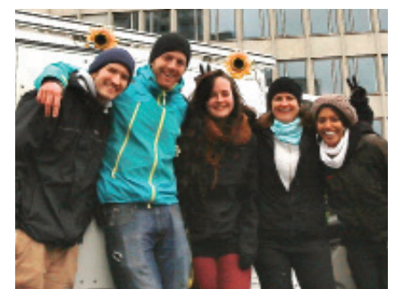
Frohe Ostern wünscht das Team