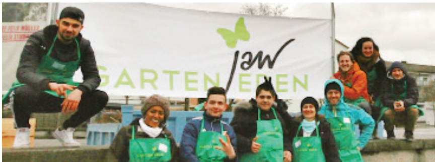
Das tatkräftige und wetterfeste «Garten jEDEN Team» www.jawetti.ch/Garten-jEden

Wind, Regen, 7 °...und 112 BesucherInnen beim KickOff. Nebst der Paten haben sich doch einige WetzingerInnen auf den Rathausplatz ge-