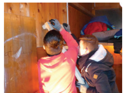
Bauen im Schöpfli

Am 19. Februar 2015 war das Patentreffen und der Informationsabend für das Projekt «Garten jEden». Bis auf eine Abmeldung sind alle Eingeladenen erschienen. Der Abend war ein voller Erfolg und alle Beteiligten freuten sich auf das Projekt und ihre Garten/Gemüsekisten.