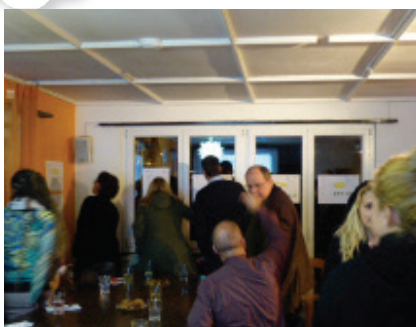
Die Paten suchen ihre Kiste aus