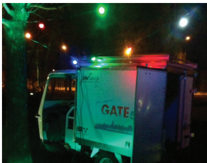
Tuk Tuk im Brühlpark

Das Tuk Tuk ist nun regelmässig, einmal im Monat, on Tour (zu finden war es im Brühlpark und an der Fohrhölzlistrasse).